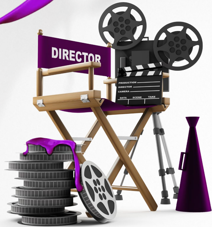
Spoty reklamowe i telewizyjne